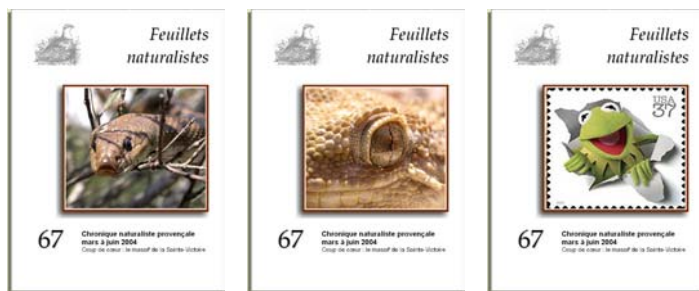
Les couvertures politiquement correctes auxquelles vous avez échappé...