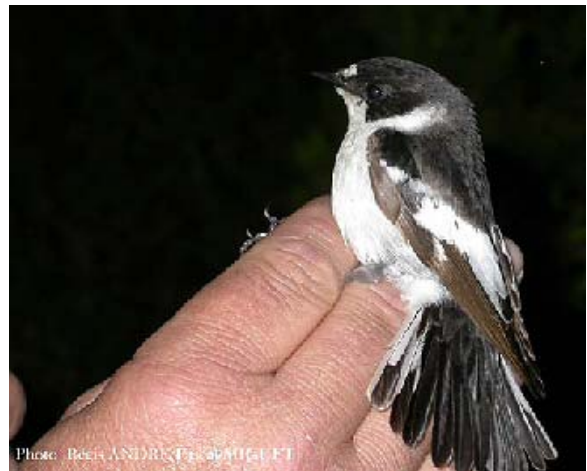
Gobemouche à demi-collier Ficedula semitorquata (Semi-collared Flycatcher), Porquerolles, 17/04/04.

Gobemouche noir Ficedula hypoleuca : 1 er aux gravières du Puy Ste Réparate, Basse Durance-13, le 01/04/04 (S. CORRE); 1 fem le 04/04/04 à Piémanson, Camargue (Y. KAYSER); 1 sur Porquerolles-83 le 10/04/04 (A. FLITTI, C. MOYON, Y. BEAUVALLET, O. HAMEAU).