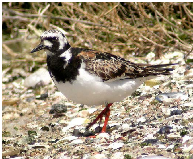
Tournepipe à collier Arenaria interpres (Turnstone), Salins de Berre-13, 08/05/04. [dig. Frank DHERMAIN]

Camargue : 5 le 08/05/04 aux Salins de Giraud (I. WASCHKIES).