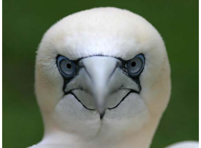
Fou de Bassan Morus bassanus (Gannett), Pont de Gau, 22/03/04.

Marseille-13 : 1 ad, bagué vraisemblablement en Angleterre, fréquente les bateaux du port de la Pointe Rouge et commence à construire un nid...depuis début