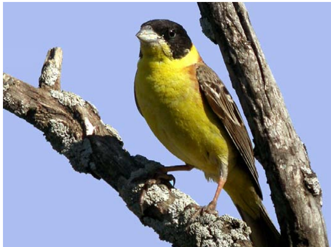
Bruant mélanocéphale Emberiza melanocephala (Black-headed Bunting), Valensole, 04/06/04.

Bruant des roseaux Emberiza schoeniclus : Vaucluse : 1 chanteur le 09/05/04 aux Confines de Monteux-84 (B. ALLEGRI); 2 dans le marais de Beauchamp, Vallée des Baux-13 le 25/05/04 (E. BECKER), nicheur probable .