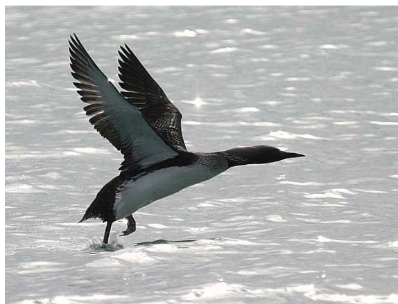
Plongeon arctique Gavia arctica (Arctic Loon), Golfe de la Grande-Motte, 18/04/04.

Camargue : 1 en mer devant la Baisse du Radeau le 01/04/04 (G. PAULUS) ; 1 nuptial à l'étang des Aulnes, Crau le 28/04/04 (G. PAULUS).