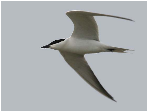
Sterne hansel Sterna nilotica (Gull billed Tern), Camargue, 17/04/04. [ph. Frank DHERMAIN]