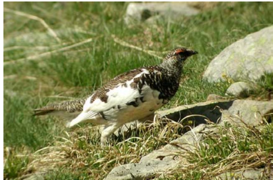
Lagopède alpin Lagopus mutus (Ptarmigan), Cétuze-05, 24/06/04.

Lagopède alpin Lagopus mutus : 2 dans le Val d'Allos-06, zone centrale du PN du Mercantour le 30/05/04 (D. FREYCHET, M. ROUX, J.F. VIDAL) ; 2 à 2400 m d'alt, flancs sud du Cime Negre, Péone-06 le 30/05/04 (I. WASCHKIES, L. BITSCH).