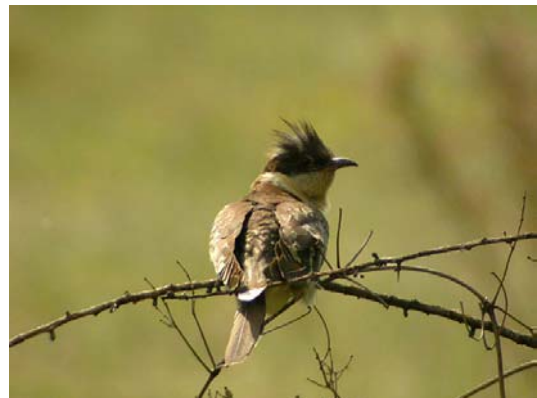
Coucou-geai Clamator glandarius (Great Spotted Cuckoo), Alleins, 11/05/04.

Coucou gris Cuculus canorus : 1 er à Gigors-et-Lozeron-26, au nord de la zone considérée, dès le 21/03/04 (F. HUMBERT), premier en Crau-13 au Terme Blanc le 27/03/04 (G. PAULUS), et à Avignon-84 le 28/03/04 (G. BLANC) ; 1 le 04/04/04 à Utelle-06 (C&C. BAUDOIN).