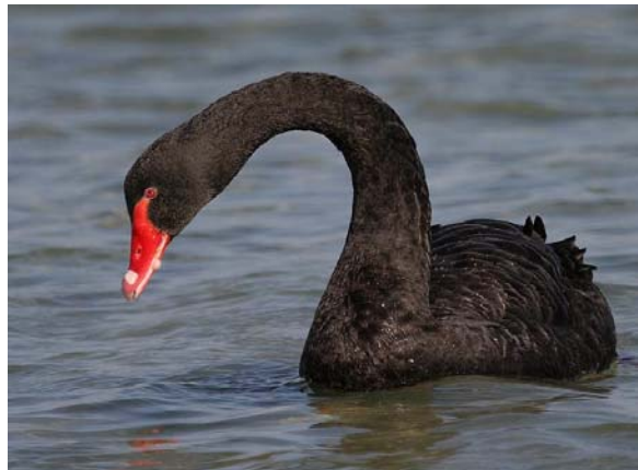
Cygne noir Cygnus atratus (Black Swan), salins de Berre, 21/03/04.

Camargue-13 : 14 à Basses-Méjanès le 02/03/04 (G. PAULUS) ; 1 en vol vers la Palissade le 15/03/04 (G. PAULUS). Dernier contact le 21/03/04 à Basses-Méjanès (T. GALEWSKI & F. VEYRUNES). 1 en vol vers la Palissade le 15/03/04 (G. PAULUS).