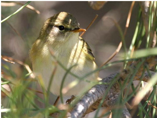
Pouillot fitis Phylloscopus trochilus (Willow Warbler), Camargue, 25/04/04.

Pouillot verdâtre Phylloscopus trochiloides * : 1 probable à Vaugrenier-06 le 19/04/04 (E. DIDNER).