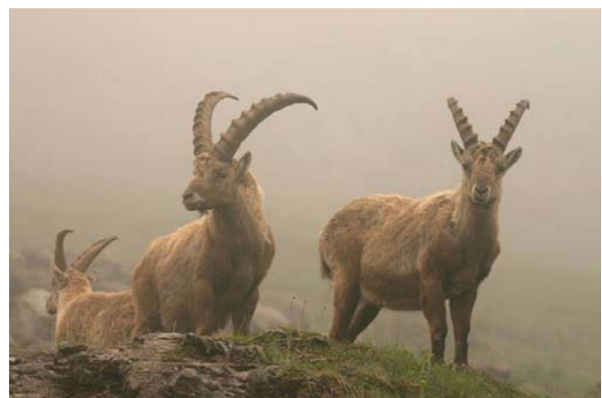
Bouquetin des Alpes Capra ibex (Alpine Ibex), Champoléon-05, 22/05/04.

1 le 23/06/04 à 0,5 miles au N-O de l'île du Levant-83 (Fide E. VIDAL).