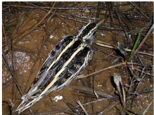
Bécassine sourde Lymnocyptes minutus (Jack Snipe), Villepey-83, 14/03/04.

Bécasse des bois Scolopax rusticola : 4, dont 3 croûlent, au Clos des Vaches, Tour du Valat, Camargue le 15/03/04 (A. OLIVIER).