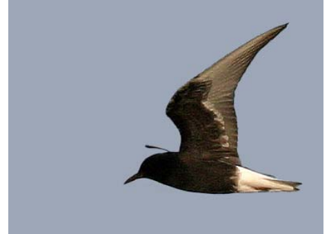
Guifette leucoptère Chlidonias leucopterus (White-winged Tern), Mas d'Agon, 18/04/04.