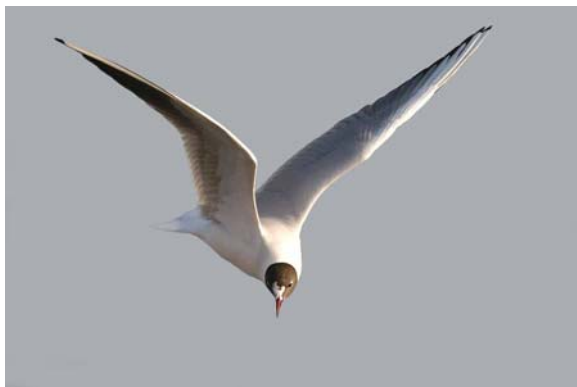
Mouette rieuse Larus ridibundus (Black-headed Gull), Salins de Berre-13, 08/05/04. [ph. Frank DHERMAIN]

Mouette pygmée Larus minutus : Embouchure du Var-06 : 1 le 03/04/04 (P. SIVET, P. MISIEK, P. BRUNNER, P. KERN, H. DUBOIS, G. AUTRAN, G. LOPEZ) et le 04/04/04 (C. JALLAIS) ; 3 le 07/04/04 (P. MISIEK, P. KERN) ; 4 le 15/04/04 (C. JALLAIS, P. KERN) ; 1 le 26/04/04 (C. JALLAIS).