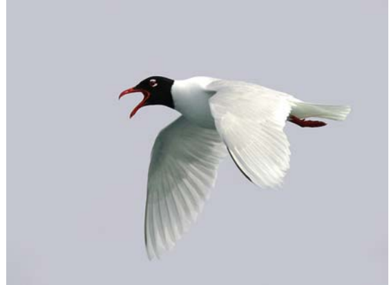
Mouette mélanocéphale Larus melanocephalus (Mediterranean Gull), large Camargue, 18/04/04.

Camargue : 760 au dortoir le 11/03/04 aux anciens marais de Barbegal, Arles (F. TRON) ; 1000 à la Chassagne le 20/04/04 (M. GAUTHIER-CLERC) ; 500 à Ste Cécile le 24/04/04 (F. BOUZENDORF & A. VINOT). Une grosse colonie de ca. 300 individus semblent s'installer sur l'étang des Launes aux Saintes-Maries de la mer (B. VOLLOT).