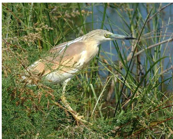
Crabier chevelu Ardeola ralloides (Squacco Heron), Sigean-11, 17/06/04.

1 aux 7 lacs de Beaumont de Pertuis-84, moyenne Durance le 04/05/04 (M.C. MARTIN), 1 le 08/05/04 à Mérindol-84 (G. JACOTOT), 1 à l'étang de Valennes à Sarrisans-84 le 10/05/04, revu le 14/05/04 (C. HEROGUEL), 1 ad aux Iles, Lapalud-84 le 23/05/04 (S. GUET), 1 le 26/05/04 au pont de Mérindol-84 (A. FLITTI) ; 1 au lac de Pelleautier-05 le 27/06/04 (J-C. GATTUS).