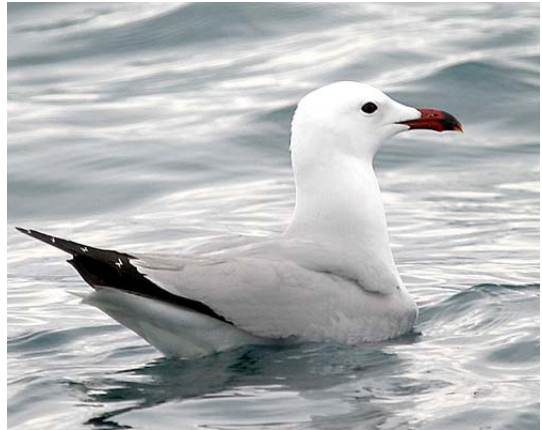
Goéland d'Audouin Larus audouinii (Audouin's Gull), large Camargue, 18/04/04. [ph. Frank DHERMAIN]

Etang de Berre-13 : 1 ad. au bord des Salins de Berre le 02/05/04 (T. LOUVEL).