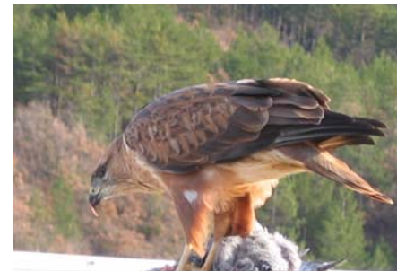
Buse féroce Buteo rufinus (Long-legged Buzzard), la Motte du Caire, juin 04.

Buse féroce orientale Buteo rufinus * : Camargue : 1 rufinus au-dessus du Sambuc le 29/03/04 (A.R. JOHNSON, J.G. WALMSLEY). 1 claire en vol au-dessus de Calissanne-13, le 17/05/04 (G. DURAND). 1 de ssp indéterminée, mais d'origine captive évidente, venait régulièrement se nourrir des pigeons sur un balcon de la Motte du Caire-04 durant le mois de juin 2004.