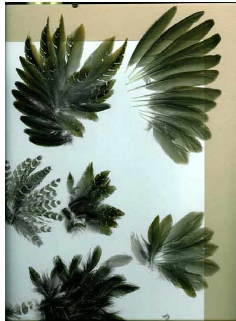
Plumée de Marouette ponctuée Porzana porzana (Spotted Crane, feathers), Courthezon-84, 18/03/04.

Fort de la Révère, Eze-06 : 10 le 07/03/04 (J. RENET) ; 216 en plusieurs groupes dont un de 120, au Baou de St Jeannet-06 le 08/03/06 (M. BELAUD).