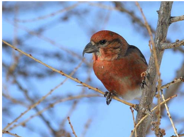
Bec-croisé des sapins Loxia curvirostra (Red Crossbill), Risoul-05, 03/03/04.

Vallée du Rhône : 1 au col du Colombier, Montjoyer-26, le 05/04/04 (G. OLIOSO) ; 1 à Verquières-13 le 01/06/04 (J-C. BOUVIER).