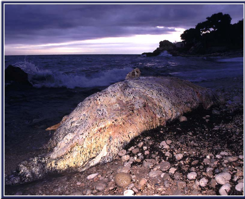
Cachalot Physeter macrocephalus (Sperm Whale), Carry-le-rouet, 02/04/04.

Dauphin bleu et blanc Stenella coeruleoalba : Cap Ferrat-06 : toujours des observations régulières lorsque la mer le permet : 12 le 21/03/04 (P. KERN).