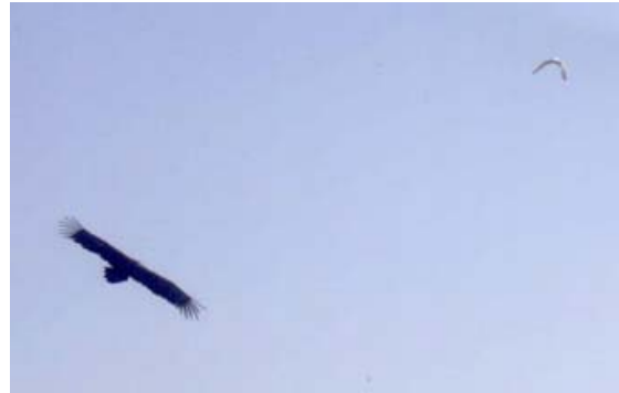
Vautour moine Aegypius monachus (Black Vulture), Calanques, 11/03/04. [ph. F. HIELY]. Une photo faite avec un petit compact ! Noter le Goéland sur la droite de la photo

Vautour moine Aegypius monachus * : Verdon-04 : 1 jeune issu des réintroductions caussenardes aux volières de Rougon, le 12/03/04 (S. HENRIQUET). Calanques-13 : 1 le 11/03/04, sous le col de Sormiou, Marseille-13, observé et photographié par un randonneur chanceux (F. HIELY). L'oiseau venait de l'est et se dirigeait nord-ouest. On a parlé d'un grand rapace noir sur les îles d'Hyères dans les semaines précédentes. Barronies-26 : au nord de notre zone, 3 (2 ad. et 1 imm.) en provenance des Causses fréquentent la colonie de Rémuzat à partir du 28/04/04 (C. TEISSIER) ; 1 d'entre eux remonte sur les Vercors le 01/05/04 (JP. CHOISY, C. TEISSIER).