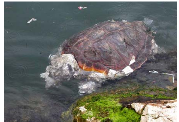
Tortue caouanne Caretta caretta (Loggerhead), Marseille, 30/04/04.

Péloodyte ponctué Pelodytes punctatus : nombreux têtards au Planas à Pujaut-30 le 22/05/04 (G. BLANC).