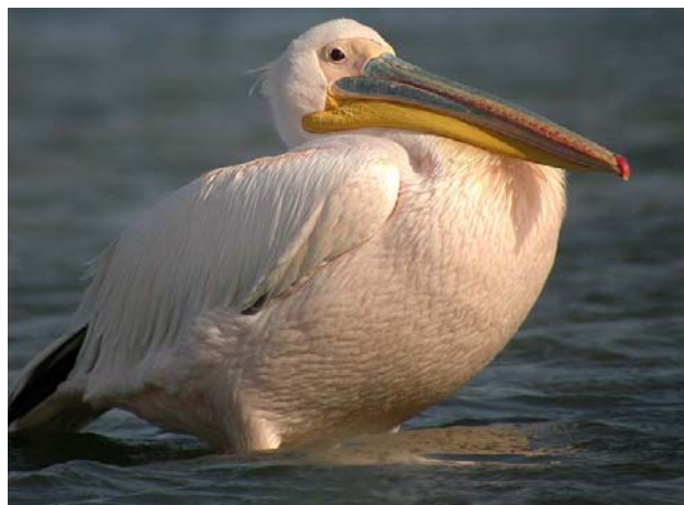
Pélican blanc Pelecanus onocrotalus (White Pelican), salins de Berre, 21/03/04. Noter sur la photo de gauche que l'oiseau vient manger les morceaux de pain que les passants jettent aux nombreux Cygnes tuberculés

Blongios nain Ixobrychus minutus : Camargue : 1 er le 21/03/04 au Pont de Gau (F. LAMOUREUX).