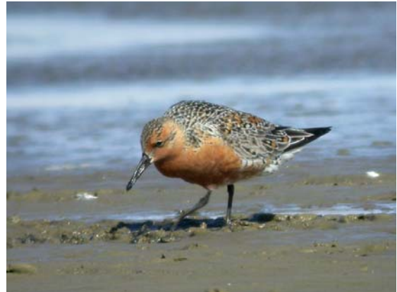
Bécasseau maubêche Calidris canutus (Knot), Camargue, 07/05/04. [dig. Ingo WASHKIES]

Moyenne-Durance : 1 ad. nuptial le 21/05/04 au lac de Curbans-05 (H. POTTIAU). Très rarement contacté en Durance