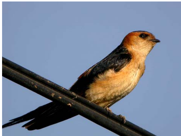
Hirondelle rousseline Hirundo daurica (Red-rumped Swallow), Signes-83, 05/06/04.

Pipit rousseline Anthus campestris : 1 er sur le Galabert, Camargue le 25/03/04 (Y. KAYSER) ; 1 au Plan de Luby, Ampus-83, le 05/04/04 (O. IBORRA) ; 2 chanteurs entre Alleins et Sénas-13 le 12/04/04 (A. FLITTI).