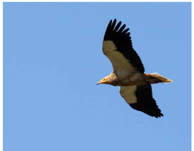
Vautour percnoptère Neophron percnopterus (Egyptian Vulture), Estramadure, Espagne 06/07/05.