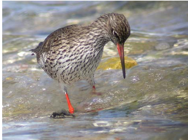
Chevalier gambette Tringa totanus (Redshank), Salins de Berre-13, 08/05/04.

Étang de Berre-13 : 141 le 02/05/04 (T. LOUVEL), seconde vague migratoire.