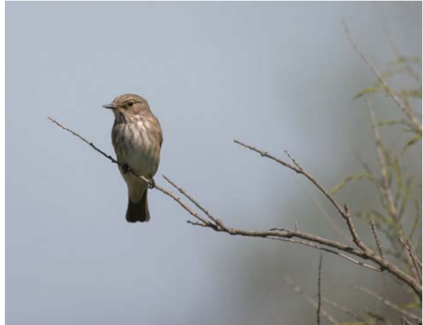
Gobemouche gris Muscicapa striata (Spotted Flycatcher), Camargue, 25/04/04.

Gobemouche à demi-collier Ficedula semitorquata : 1 ère française avec la capture d'un mâle sur Porquerolles-83 le 17/04/04 (P. MIGUET, R. ANDRE, C. MOYON, Y. BEAUVALLET).