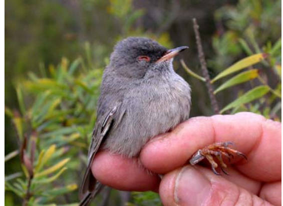
Fauvette sarde Sylvia sarda (Marmora's Warbler), Porquerolles, 17/04/04.

1 capture à Porquerolles-83 le 17/04/04 (P. MIGUET, R. ANDRE, C. MOYON, Y. BEAUVALLET).