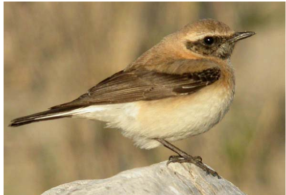
Traquet oreillard Oenanthe hispanica (Black-eared Wheatear), Camargue, 21/04/04. [dig. Marc THIBAUT]

Vaucluse-84 : 3 en vol au-dessus de Montfavet le 25/03/04 (O. PEYRE) ; 1 mâle alpestris sur les bords de la Meyne, au sud d'Orange, le 28/03/04 (B. NABHOLZ) ; 1 mâle torquatus à Montjoyer-26 le 06/04/04 (G. OLIOSO) ; 1 au Saint Serein, Beaumont du Ventoux-84 le 10/05/04 (B. ALLEGRIANI).