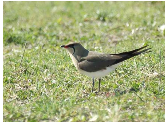
Glaréole à collier Glareola pratincola (Pratincole), Montoux-84, 26/04/04.

Vaucluse-84 : 1 à Montoux-84 le 26/04/04, première mention en Vaucluse depuis 1950 (B. ALLEGRI), revue le 27/04/04 (B. VOLLOT, G. OLIOSO).