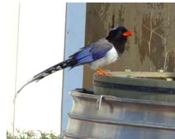
Pyrolle à bec rouge Urocissa erythrorhynca (Red-billed blue Magpie), Saint-Mandrier, mai 04.

Plaine de Cuges-13 : 1 mâle le 25/05/04 (G. VIRICEL).