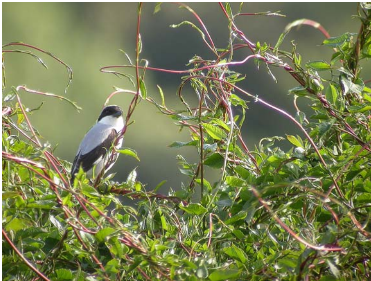
Pie-grièche à poitrine rose Lanius minor (Lesser grey Shrike), Cuges-13, 20/05/04.

Pie-grièche écorcheur Lanius collurio : 1 ère le 02/05/04 à Mas Chauvet, Crau (G. PAULUS) ; 1 mâle dans la ZI de la Barasse, Marseille le 01/06/04 (E. BARTHELEMY) ; 1 couple cantonné autour d'un buisson à Sénas-13 le 06/06/04 (G. JACOTOT), l'espèce est une nicheuse exceptionnelle dans les plaines provençales.