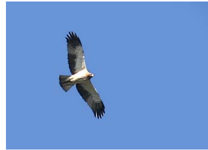
Aigle botté Hieraaetus pennatus (Booted eagle), Sylvéreal-13, 17/04/04

Alpes-Maritimes : 1 à Levens le 28/03/04 (C&C. BAUDOIN)