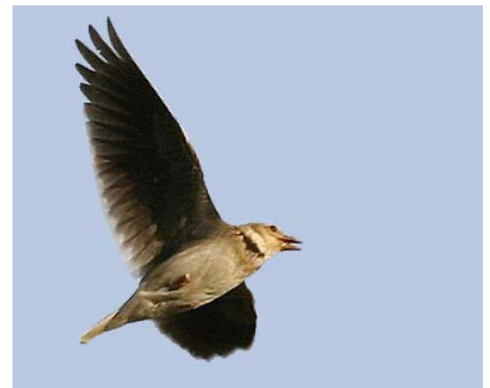
Alouette calandre Melanocorypha calandra (Calandra Lark), Crau, 19/04/04.

Camargue : 2 les 12 et 14/04/04 à Piémanson (H. KOWALSKI, Y. KAYSER) ; 1 le 11/05/04 à Palunette de Saliers (N. VINCENT-MARTIN) : 1