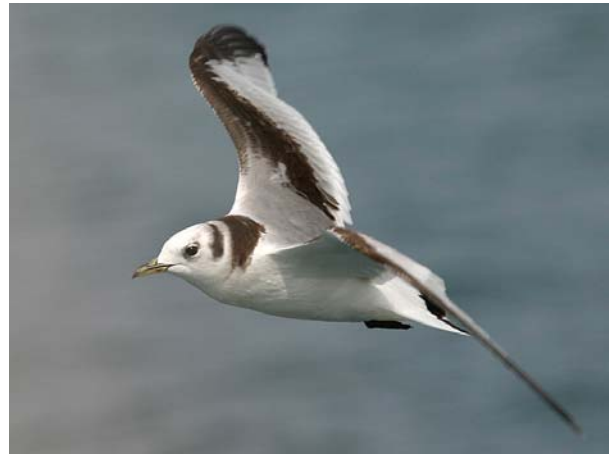
Mouette tridactyle Rissa tridactyla (Kittiwake), 1 an, large Camargue, 18/04/04.

Mouette tridactyle Rissa tridactyla : Cap Ferrat-06 : sea-watching : 1 imm. le 13/03/04 (P. MISIEK, P. KERN, C. JALLAIS).