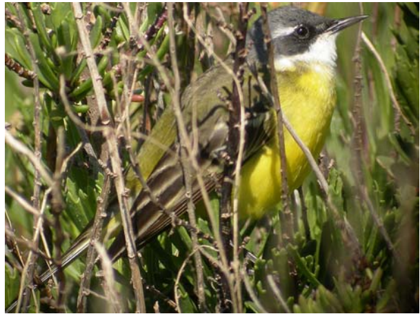
Bergeronnette printanière Motacilla flava iberiae x cinereocapilla (Yellow Wagtail), Salins de Berre, 08/05/04.

Bergeronnette flavéole Motacilla flava flavissima ® : 1 aux gravières du Puy-Ste-Réparate, Basse-Durance, le 03/04/04 (E. DURAND) ; 2 (3 ?) aux Paluns de Marignane-13 le 04/04/04 (E. FRANC) ; 1 à la Digue à la mer, Camargue, le 04/04/04 (B. NABHOLZ) ; 1 le 07/04/04 au St Seren, Camargue (Y. KAYSER) ; 1 le 14/04/04 en Crau (S. PROVOST) ; 1 à la Digue à la mer, Camargue le 25/04/04 (H. BOURGEOIS-COSTA) ; 1 mâle dans la plaine de l'Argens le 22/04/04 (S. DETALLE).