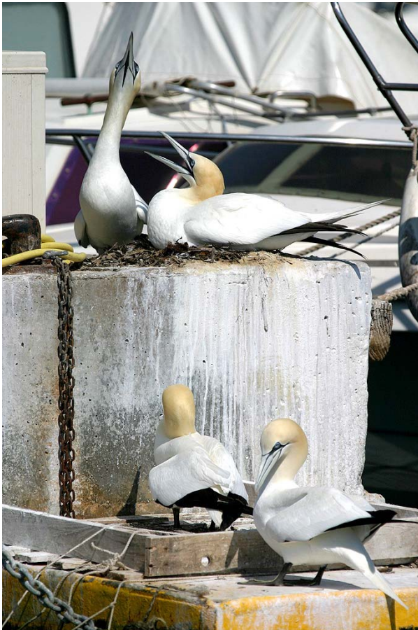
Fou de Bassan Morus bassanus (Gannett), port de Sausset, 24/04/04.

avril jusqu'à fin mai 2004 (S. MERCIER, A. MANTE ; A. GUIGNY). Grâce à la lecture de sa bague métal, nous pouvons savoir que l'oiseau déjà fréquentait déjà le port de Bandol en 1997... (M. BOUILLOT).