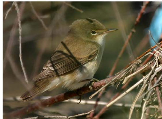
Rousserolle verderolle Acrocephalus palustris (Marsh Warbler), Camargue, 25/04/04.

Rousserolle turdoïde Acrocephalus arundinaceus : 1 ère le 07/04/04 aux Marais du Vigueirat (M. CHAMBOULEYRON) ;