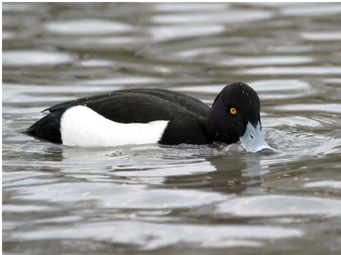
Fuligule morillon Aythya fuligula (Tufted Duck), Pont de Gau, Camargue, 26/06/04.

Sarcelle d'été Anas querquedula : Camargue : 1 ères le 05/03/04 aux Marais du Vigueirat (M. CHAMBOULEYRON) ; notées sur la Tour du Valat le 10/03/04 (Y. KAYSER) ; arrivée massive le 14/03/04 au Mas d'Agon, Mazet de Fabre, étang des Launes et étang de Consécanière (N. VINCENT-MARTIN) ; 1 mâle au St Seren le 16/06/04 (G. PAULUS).