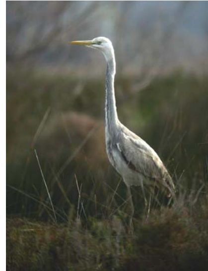
Héron cendré x Grande Aigrette Ardea cinerea x alba (Grey Heron x Great White Egret) présumé. Romieu, 20/03/04 (dig. M. THIBAUT)

Ibis sacré Threskiornis aethiopicus ® : 1 le 26/03/04 au Pèbre, Camargue (M. THIBAUT) ; 1 au Mas de Peint, Camargue le 21/04/04 (D. COHEZ).