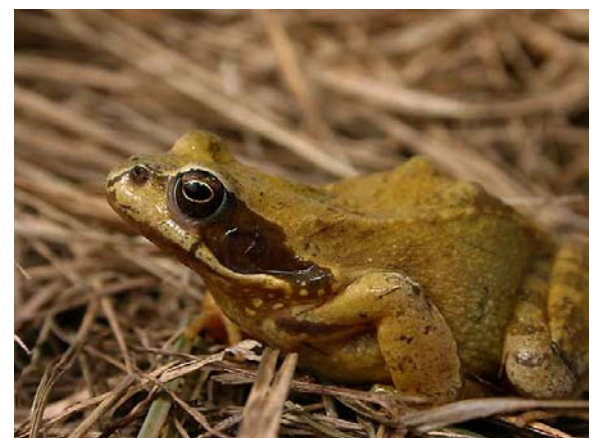
Grenouille rousse Rana temporaria (European Brown Frog), plateau de Bayard-05, 20 mars 2004